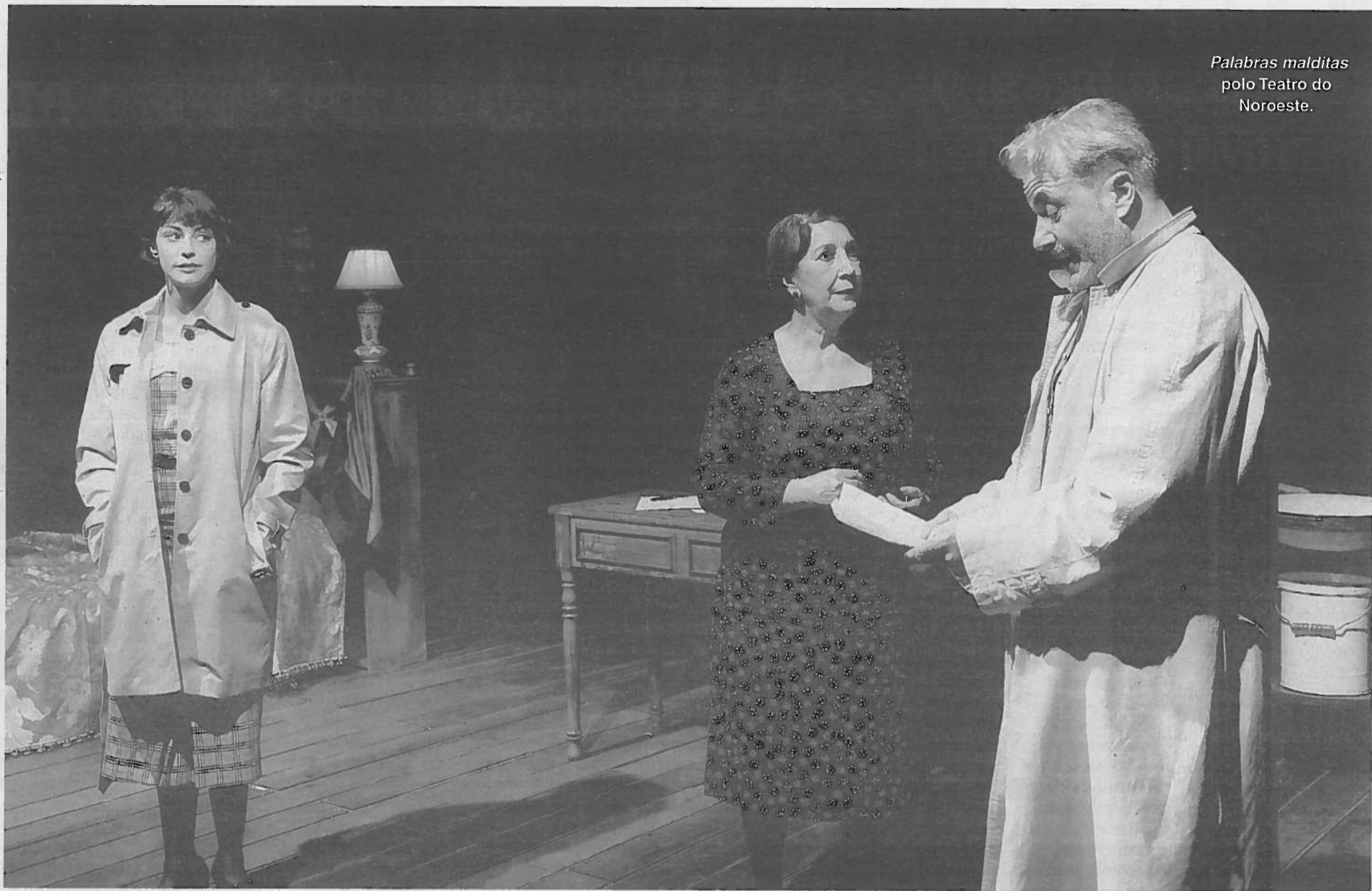
Palabras malditas polo Teatro do Noroeste.

Sempre se afirmou que o teatro é un medio de coñecemento, unha forma de confrontarnos con outras realidades, con outras formas de entender a existencia, con outras formas de ver os problemas grandes e pequenos, con nós mesmos. Rafael Dieste no seu ensaio La vieja piel del mundo , mostraba que o teatro vai ser a primeira forma de facer historia de nós, pois en efecto as comunidades representan o que foi, e ao facelo, reconécese, recórdano, aínda que o pasado sexa por veces causa de dor ou de vergoña. Por tal razón Frínico (511-470 AC) foi multado pola cidade de Atenas por presentar a concurso a traxedia A toma de Mileto , na que recreaba a caída da cidade lidia nas mans do exercito persa. Atenas non soubo aturar aquela derrota considerada indigna e pavorosa, pero si gozou con Os persas , de Esquilo, que recreaba a derrota persa en Salamina.